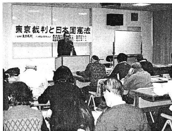
公開例会では基調講演も

憲法九条を平和憲法の要とし、その改正に警鐘を鳴らし続ける富士・九条の会」による公開例会が先ごろ、同市中央町のラ・ホール富士で開かれた。 例会は、「東京裁判(極東国際軍事裁判)と日本国憲法」をテーマに、東京裁判の様子をまとめたドキュメントニュース映像の上映、関係者三人がパネリストを務めての基調講演と質疑応答が続いた。 このうち、東京裁判を題材とした基調講演では、「裁判が第二次大戦で国民に知らされなかった軍部の画策などの部分を明らかにし、国際人道法発展に大きく貢献したことは事実」と評価したものの、「裁判員は十一カ国の代表から成っていたが、アメリカの主導で進み、勝者の裁き」との批判が強い。さらに、日本